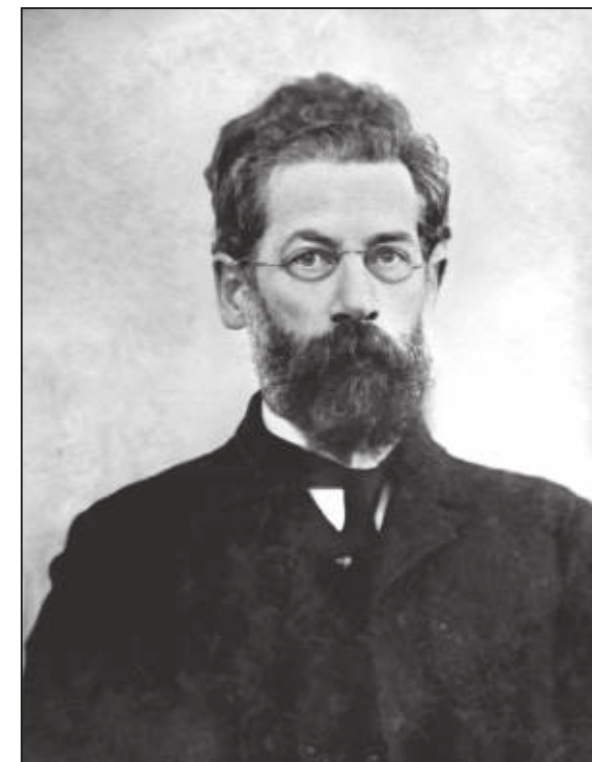
Роман Христианович Лепер

РНБ — Российская Национальная библиотека; ЦГА СПб — Центральный государственный архив Санкт-Петербурга; ЦГИА СПб — Центральный государственный исторический архив Санкт-Петербурга; ЕАА — Национальный архив Эстонии.