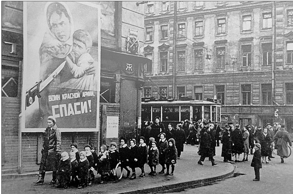
Дети блокадного Ленинграда

порой замкнутых, робких или наивно беспечных девушек и женщин, попавших иногда случайно в детский сад на должность няни, прачки, дворника и порой избалованных и изнеженных, пришедших на должности воспитателя после своей работы секретарем, чертежником, преподавателем английского языка и т. п.