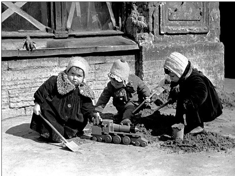
Дети блокадного Ленинграда