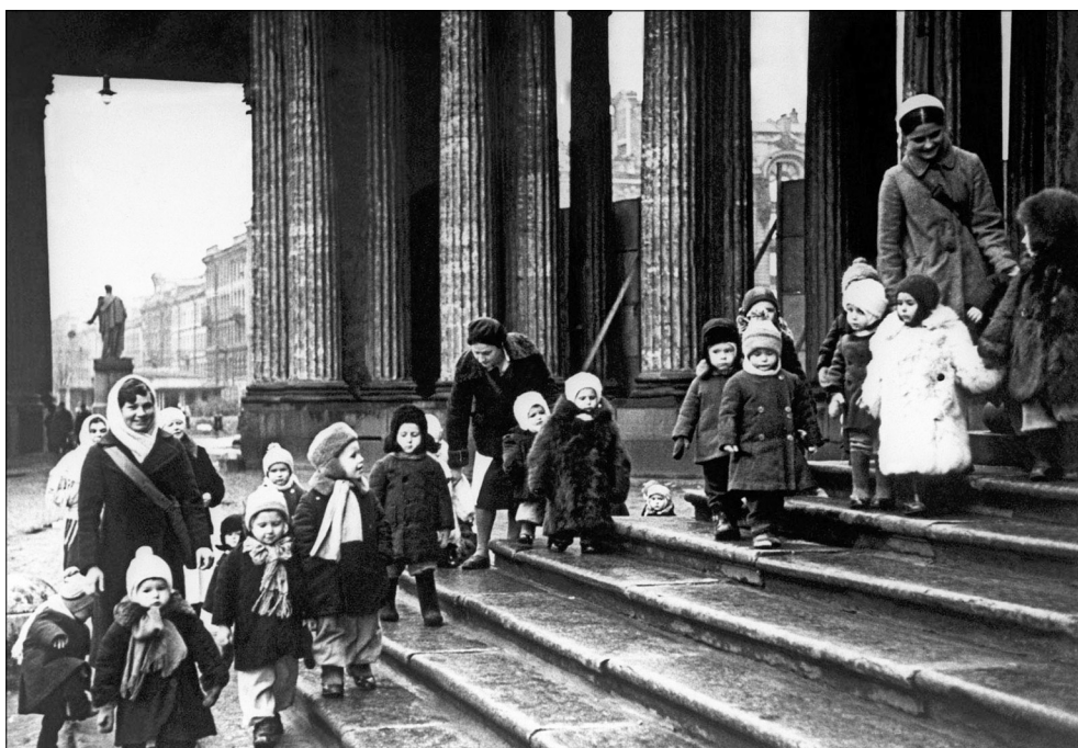
Воспитанники детского сада у Казанского собора