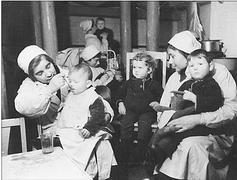
Блокадный детский сад